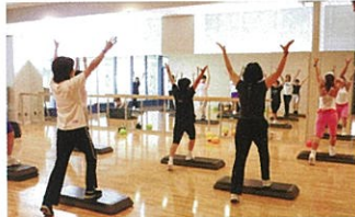
フィットネススタジオ