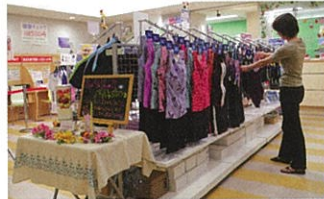
ショップ「健康サービスステーション」