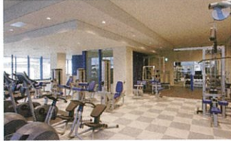
トレーニングジム