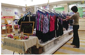
ショップ「健康サービスステーション」