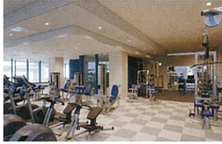
トレーニングジム