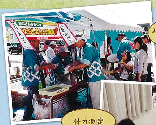
みたらしだんごの販売

今回はオカザえもんを迎えて、「岡崎の魅力発見クイズ」では、ちびっこたちで大盛況！キック