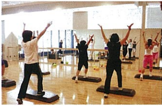
フィットネススタジオ