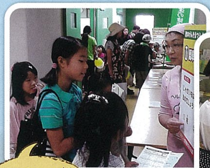
じゃがじゃこ餅の試食