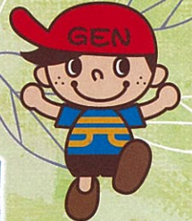
岡崎げんき館市民会議 マスコットキャラクター ゲンくん

岡崎げんき館市民会議は、岡崎げんき館を拠点として、健康づくりや子ども育成などに関する事業を、岡崎市や事業者と連携しながら実施し、「健康おかざき21計画」などに基づく市民の健康づくりを推進していくことを目的として活動しています。