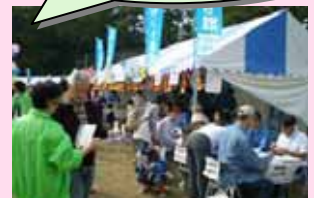
市民まつり(岡崎公園) 健康フェスティバル