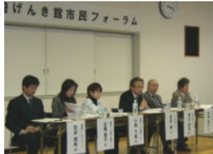
「生涯現役の推進方法について」星先生の楽しい講演会“生涯動こう!”

市民フォーラムの様子や、星先生の基調講演の概要は、ホームページにも掲載していますので、参加できなかった方はぜひ「(仮称)岡崎げんき館ホームページ」をご覧ください。 http://www.city.okazaki.aichi.jp/yakusho/ka5075/ka701.htm